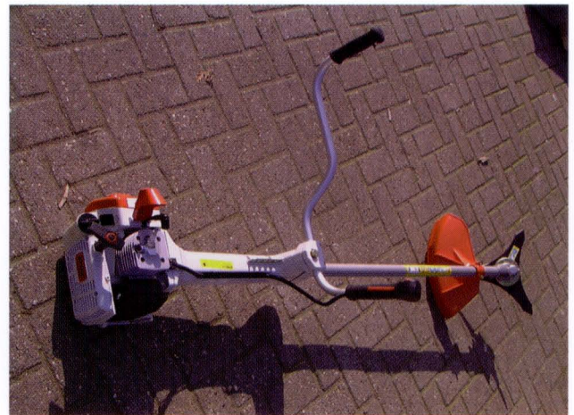
Een gebruiksklare bosmaaier.