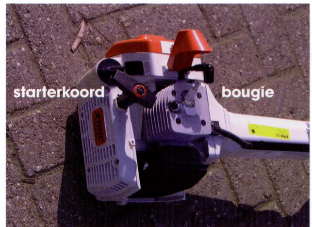
Starterkoord en bougie.